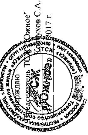
ГРАФИК ПЕРИОДИЧНОСТИ санитарной уборки МКД № 31 по ул. Южно-Якутской 01.07.2017 г. по 30.06.2018 г.