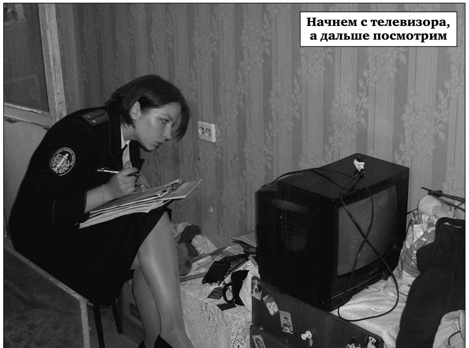
Начнем с телевизора, а дальше посмотрим

Для того, чтобы заставить злостных неплательщиков расплатиться за уже оказанные им услуги, и власть, и управляющие компании давили, в основном, на совесть квартировладельцев. Ведь согласитесь, если в многоквартирном доме большинство его жильцов платит, а пара-тройка владельцев