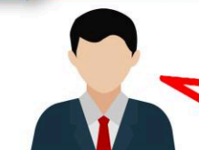
«ЛЖЕСОТРУДНИК БАНКА ИЛИ ОРГАНИЗАЦИИ»

«Ваши данные попали в третьи руки и на Вас пытаются оформить кредит» «С Вашей карты пытаются перевести деньги» «Ваша карта (счёт) заблокированы» «Вам звонит «сотрудник Госуслуг» для установки самозапрета на кредиты»