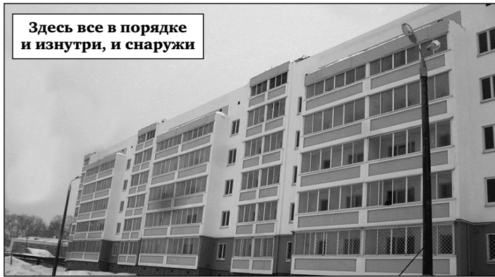
Здесь все в порядке и изнутри, и снаружи