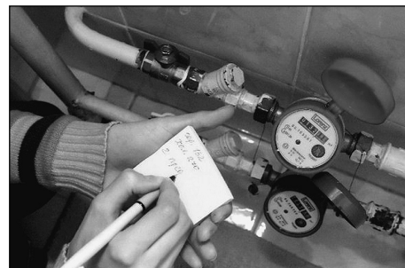
Показания общедомовых приборов надо снимать с 23 по 26 число каждого месяца

Причина 2. После установки квартирных счетчиков у Потребителей возникает обязанность в предоставлении показаний для расчетов за коммунальные ресурсы, а так же в их исправности и сохранности пломб. Согласно п. 31,34 Постановления № 354 показания счетчиков следует ежемесячно снимать в период с 23 по 26 число и передавать их в расчетный центр до 10 числа при оплате квитанции. Данное требование связано с тем, что показания