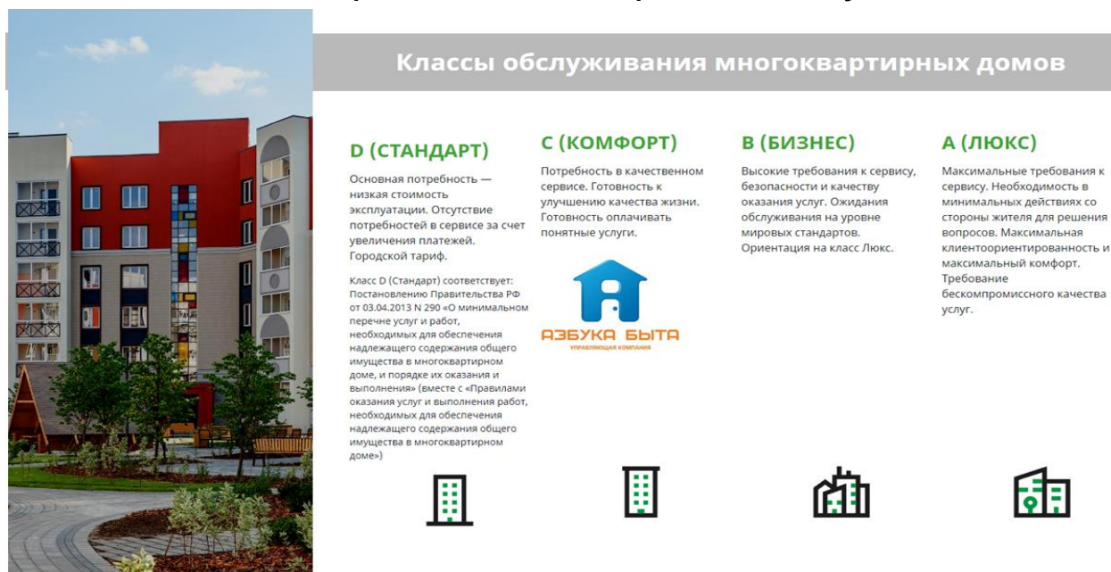
Рис.1. Классификация стандартов обслуживания

В связи с чем, УК Азбука быта инициировано ОСС по пересмотру экономически обоснованного тарифа для продолжения качественного содержания МКД по классу «С комфорт» в размере 26,29 руб. (с учетом включения в тариф новой статьи «текущий ремонт» ). Но, по итогам ОСС, тариф на содержание не принят.